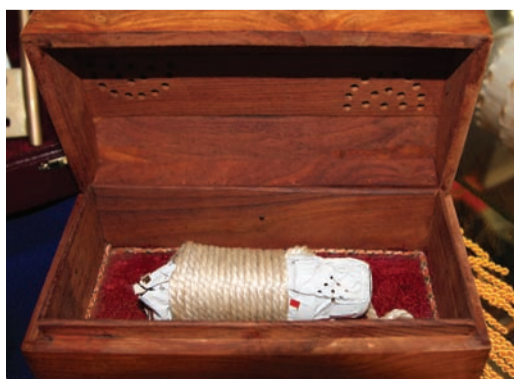
Горлышко бутылки шампанского как напоминание о торжественной церемонии спуска на воду ППБУ «Полярная звезда»