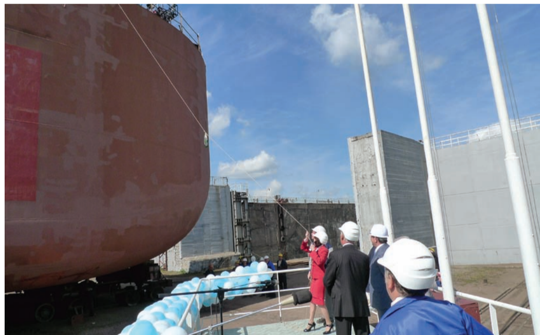
Торжественный спуск понтона ППБУ «Полярная звезда»

Первоначально, в Императорской России, на празднество по случаю постройки нового корабля собирались адмиралы, высшие государственные чины и знать. На некоторых церемониях присутствовал и сам император или члены его семьи. Проводился торжественный молебен, во время которого священники высокого ранга