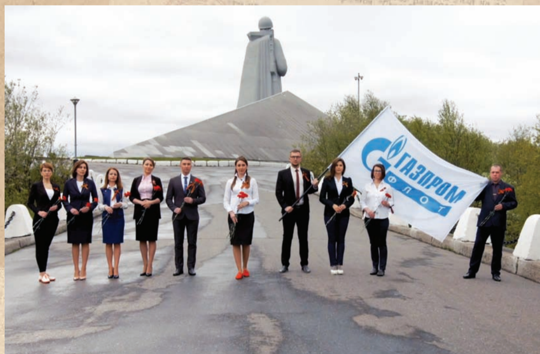
Работники филиала ООО «Газпром флот» в г. Мурманске