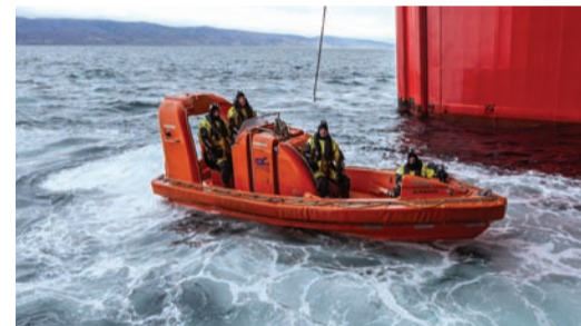
Учения на ППБУ по тревоге «человек за бортом»