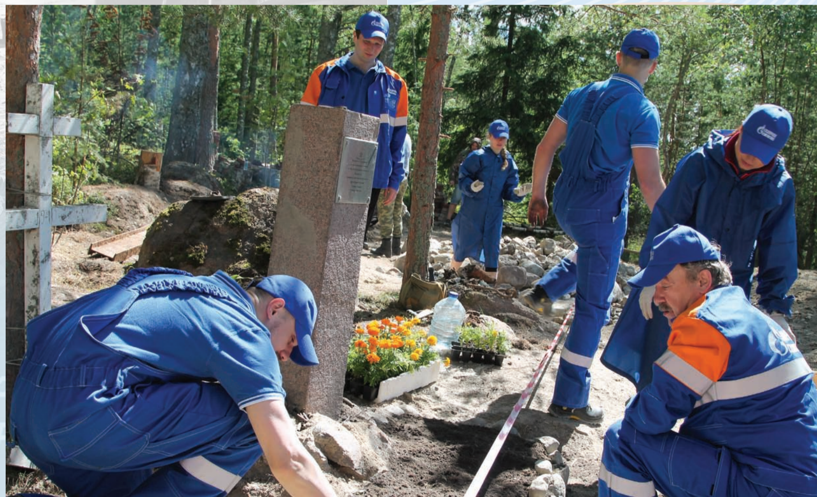
Работники ООО «Газпром флот» на благоустройстве братского захоронения

В этом году работники ООО «Газпром флот» присоединились к поисковым отрядам «Советский патриот» и «Космос», став участниками поисковых мероприятий, и внесли свой вклад в восстановление мемориального комплекса на острове Клётс.