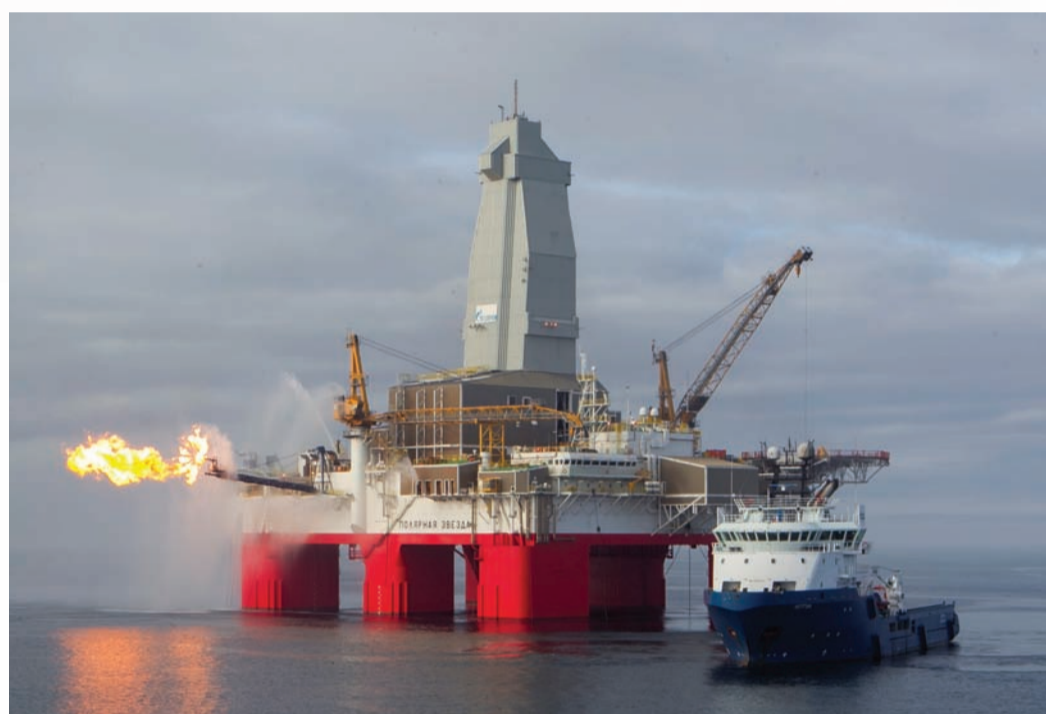
ППБУ «Полярная звезда» и ТБС «Нептун»