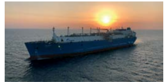
Танкер-газовоз СПГ «Портовый»

Приёмка судна в эксплуатацию запланирована в декабре в порту Калининграда,