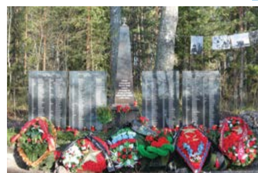
Мемориал на острове Клётс