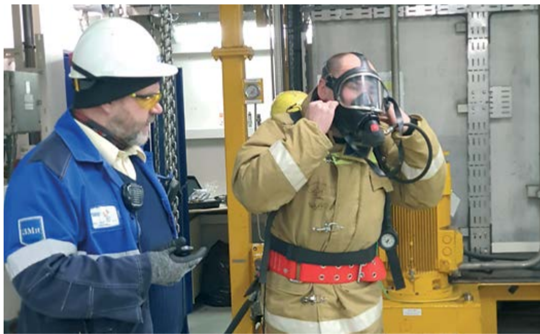
Участники конкурса на этапе «Оценка практических навыков»

В период со 2 марта по 30 октября 2020 года в целях повышения уровня профессионального мастерства матросов ПБУ и судов и для обеспечения безопасного, бесперебойного, технически правильного осуществления буровых работ и эксплуатации судов в компании проводился конкурс профессионального мастерства на звание «Лучший матрос ООО «Газпром флот» (далее – Конкурс).