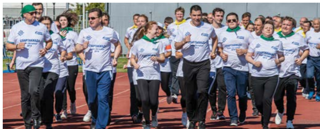
Участники спартакиады в 2019 году