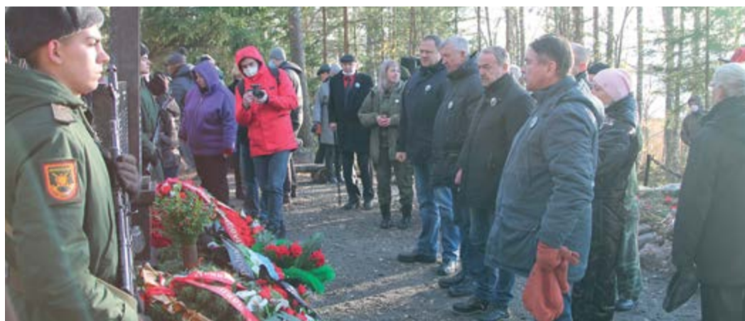
Минута молчания у военного мемориала на о. Клётс

Был создан и установлен мемориальный комплекс, на стелах которого высечены имена 324 красноармейцев 43-й стрелковой дивизии, которая участвовала и в Советско-финляндской, и в Великой Отечественной войнах.