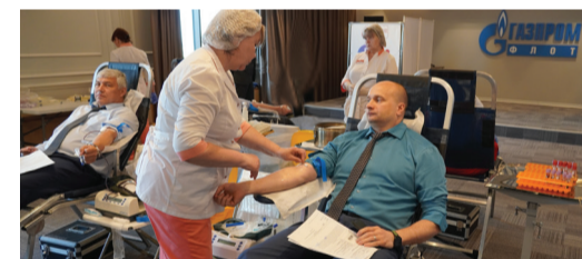
Работники ООО «Газпром флот» сдают кровь

В этот день кровь сдали опытные доноры и новички в этом деле. Каждый из них – часть российской команды добровольцев, насчитывающей около 2,5 миллионов человек, которая участвует в спасении человеческих жизней.