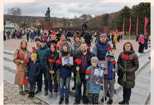
Работники филиала «Газпром флота» в Южно-Сахалинске

Акция «Бессмертный полк» стала символом сплочения народов, желающих сохранить память о подвиге своих дедов и прадедов. Газпромфлотовцы участвовали в ней целыми семьями, вспоминая с подрастающим поколением о родственниках, которые вместе со всей страной на фронте и в тылу вносили вклад в приближение победного мая. Взрослые рассказывали детям о том, почему было важно разгромить нацистскую Германию и её союзников, отстоять независимость нашего государства.