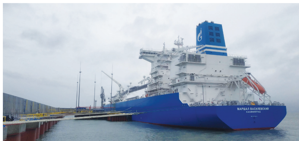
ПРГУ «Маршал Василевский»

В заключение ещё раз отметим, что на всех судах экипажи полностью состоят из российских моряков и специалистов, «Газпром флот» постоянно расширяет свои компетенции, увеличивает флот и тем самым принимает активное участие в развитии российской отрасли СПГ, внося свой вклад в обеспечение энергетической независимости и безопасности нашей страны.