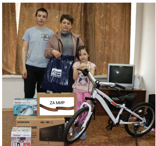
Подарки для эвакуированных от Мурманского филиала

Эвакуированных ребят и воспитателей разместили в ПВР на базе детского оздоровительного лагеря «Ракета» в Лискинском районе. Спустя некоторое время группу детей с ограниченными возможностями здоровья (далее – ОВЗ) направили в специализированный Бобровскую школу-интернат, подходящую для проживания и обучения детей с ОВЗ.