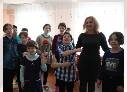
Воспитанницы Ирминской школы-интерната (ЛНР) со своим педагогом в Бобровской школе-интернате Воронежской области

детских учреждений и жители Донбасса пожелали всем работникам «Газпром флота» добра, мира и крепкого здоровья.