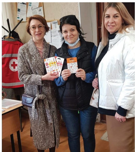
Работники филиала «Газпром флота» в г. Калининграде передают сертификаты семьям из Донбасса

Благотворительную акцию поддержал весь наш трудовой коллектив: она прошла в подразделениях, расположенных в Санкт-Петербурге, Москве, Калининграде, Мурманске и Южно-Сахалинске. В течение месяца всем вместе удалось собрать гуманитарную помощь для жителей, эвакуированных из ДНР и ЛНР.