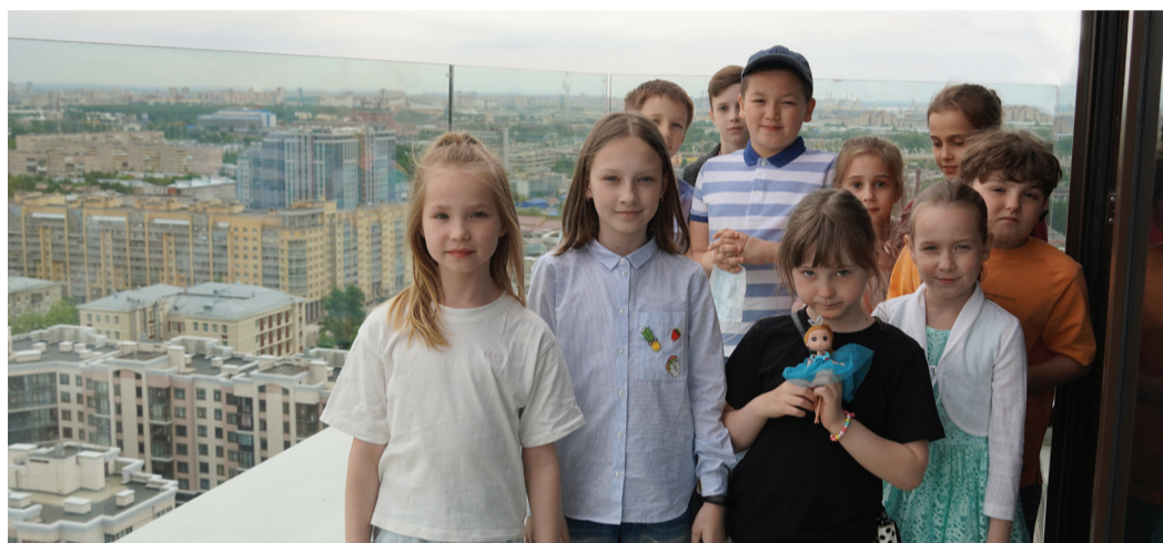
Дети работников ООО «Газпром флот» в офисе Администрации в г. Санкт-Петербурге

При этом всё, чего хотят жители народных республик, измученные постоянным страхом и ужасом потерь, – скорейшего прекращения обстрелов и восстановления разрушенных домов и социальных учреждений на своей Родине, чтобы родители без опаски водили дошколят в садики, школьники и студенты учились в родных городах и регионах. Чтобы представители подрастающего поколения могли просто расти счастливыми, заниматься любимым делом, стать в будущем замечательными родителями и гражданами своей страны.