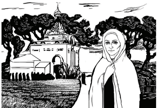
Блаженная Ксения Петербургская

Все моряки и причастные к этой профессии люди знают, что покровителем мореплавателей является Святитель Николай, или Николай Чудотворец. Он славился даром исцеления и провидения. Согласно жизнеописанию, будучи молодым человеком, Николай отправился учиться в Александрию и в одном из путешествий воскресил моряка, который в шторм сорвался с корабельной оснастки и разбился насмерть. В другом случае Николай усмирив бурю, из-за которой корабль терпел бедствие. Испокон веков Николай – покровитель людей энергичных и независимых. Помогал он и девушкам-бесприданницам, вдовам и сиротам. Частица мощей Святого Николая Чудотворца покоится в Николо-Богоявленском Соборе на Никольской площади в Санкт-Петербурге.