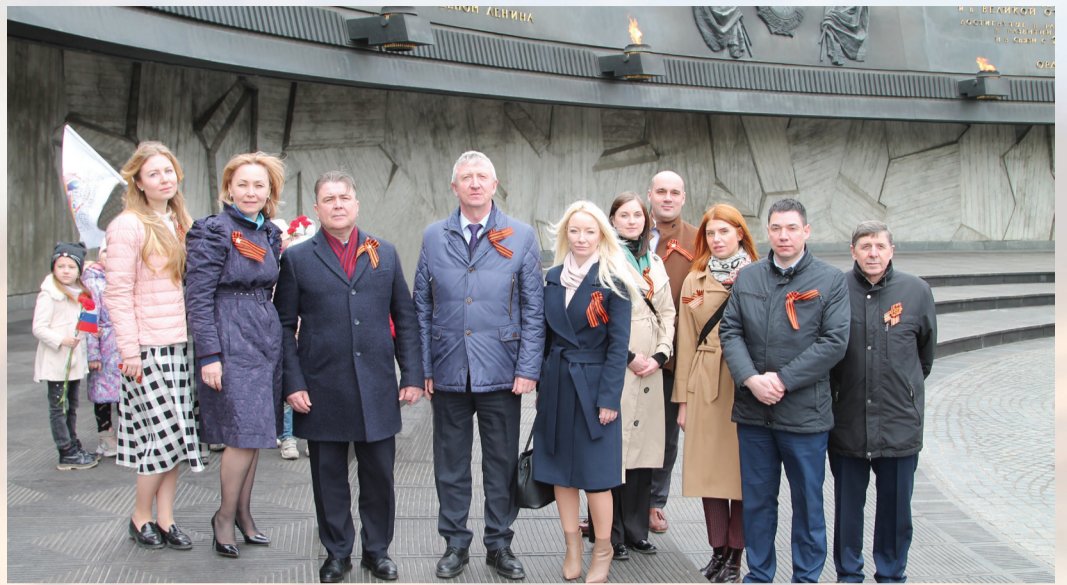
Работники ООО «Газпром флота»

Для ребят, находящихся в ПВР на территории оздоровительного лагеря «Ракета», нами была приобретена современная акустическая система, чтобы пе-