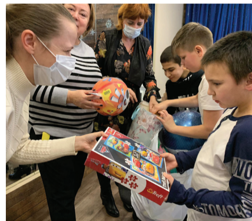
Подарки детям школы-интерната от работников филиала

Трудовой коллектив филиала является единым целым со всем нашим предприятием и готов к выполнению любых производственных задач.