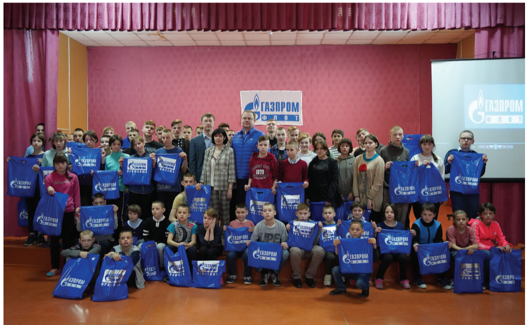
Работники «Газпром флота» с воспитанниками Ирминской школы-интерната и Бобровской школы-интерната

Значительный объём гуманитарной помощи для жителей, размещённых в ПВР на территории Мурманской области, направил трудовой коллектив Мурманского филиала нашего предприятия.