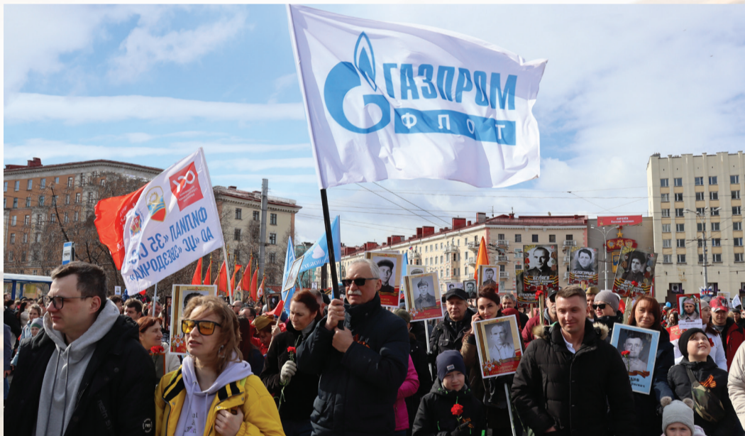
Работники филиала «Газпром флота» в Мурманске

В этом году перед 9 мая в петербургском офисе и филиалах нашей компании каждый работник с большим почётом повязал на груди, возле сердца, чёрно-оран-