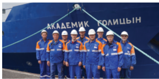
ПОЗДРАВЛЕНИЕ С 29-ЛЕТИЕМ ООО «ГАЗПРОМ ФЛОТ» стр. 2