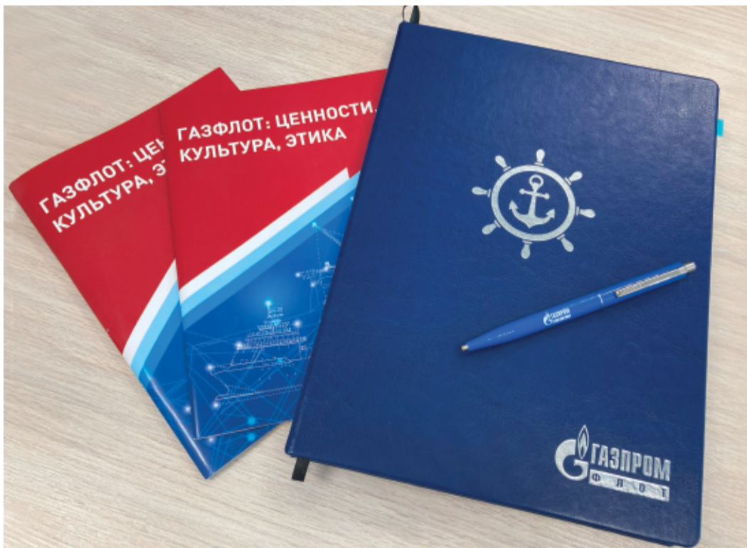
Сборник основ корпоративного поведения