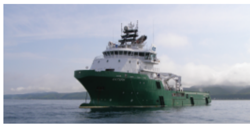
РЕМОНТ ЗАВЕРШИЛСЯ стр. 3