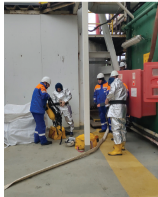
Учения «Пожарная тревога»