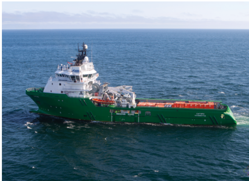
■ Транспортно-буксирное судно «Сатурн»

После успешно проведённого очередного освидетельствования ТБС «Сатурн» без промедления ушло в море на выполнение поставленных ООО «Газпром флот» производственных задач.