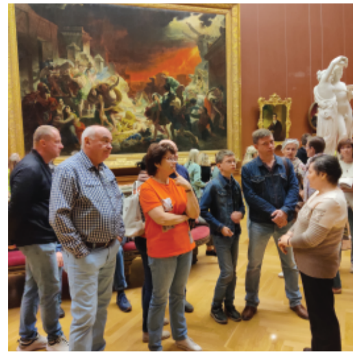
В Русском музее

Ещё одна экскурсия, приуроченная ко Дню России, состоялась в июне в Русском музее. Сотрудники «Газпром флота» вместе с родными увидели шедевры и сокровища русского искусства – для