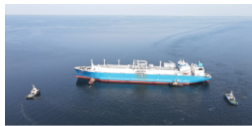
С ДНЁМ РАБОТНИКОВ МОРСКОГО И РЕЧНОГО ФЛОТА стр. 4