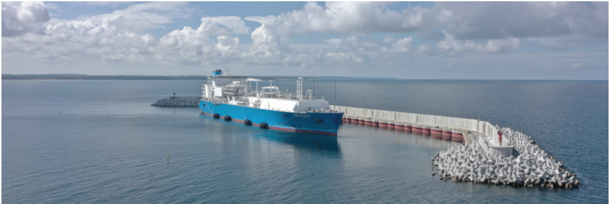
ПРГУ «Маршал Василевский»