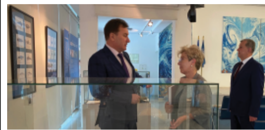
ДОБРЫЕ ДРУЗЬЯ стр. 7