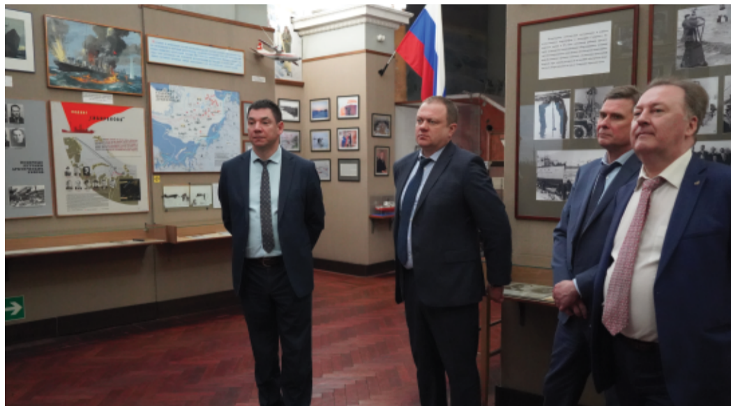
В музее Арктики и Антарктики

Русский музей открылся 19 марта 1898 года. Фондом музея служили предметы и произведения искусства, переданные из Зимнего, Гатчинского и Александровского дворцов, из Эрмитажа и Академии художеств, а также коллекции частных собирателей, переданные музею в дар. Коллекция музея насчитывает более 440 000 экспонатов и охватывает все исторические периоды и тенденции развития русского искусства, основные виды и жанры, направления и школы более чем за 1 000 лет.