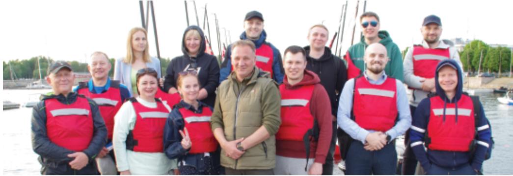
Море не отпускает и после работы

Основа праздника заложили Пётр Первый, когда 30 октября 1696 года постановил: «Морским судам быть!». С тех пор началась славная эпоха создания российского флота, его кадрового состава и становления нашей страны как крупной морской державы. Интересно, что водный транспорт превратился в единую отрасль народно-