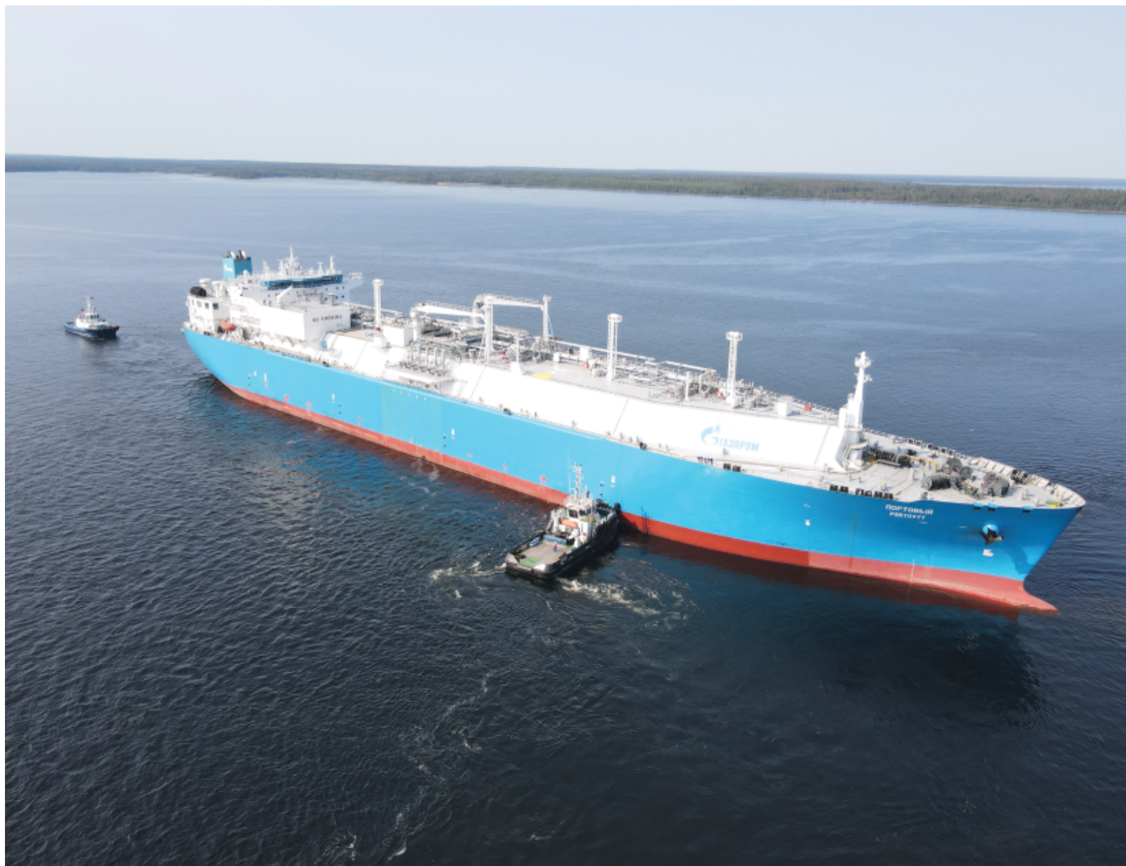
Швартовка судна-газовоза «Портовый»