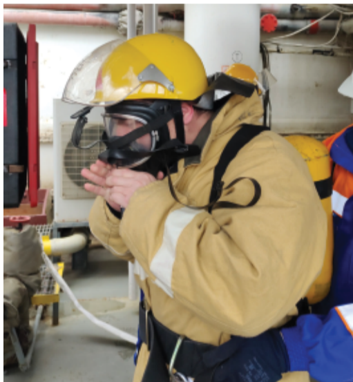
Проверка герметичности маски

На СПБУ «Амазон» как на опасном производственном объекте провели противопожарную тренировку по