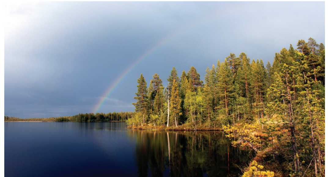
А.Н. Зиновьев, 1-е место, номинация «Отдых на море»

Добавим, что силами ППО «Газпром флот профсоюз» наши призёры получили памятные дипломы и подарочные сертификаты, которые можно потратить на воплощение своих давних желаний. ■