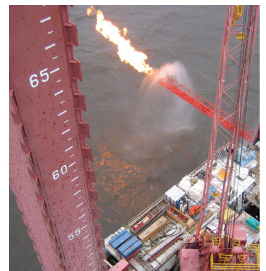
Факел на СПБУ «Амазон»