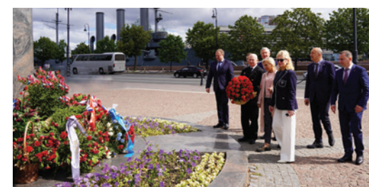
Цветы к подножию памятника «Морякам и создателям флота России»

историко-просветительской общественной организации «Память земли нашей», представители администрации посёлка Гаврилово, местные жители с детьми и внуками, сотрудники «Газпром флота». Они почтили светлую память погибших защитников Отечества и возложили цветы к обелиску.