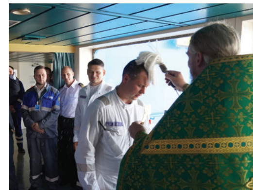
Окропление святой водой