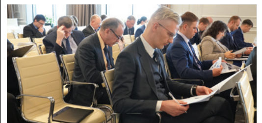
КРОССВОРД ДЛЯ ЗНАТОКОВ