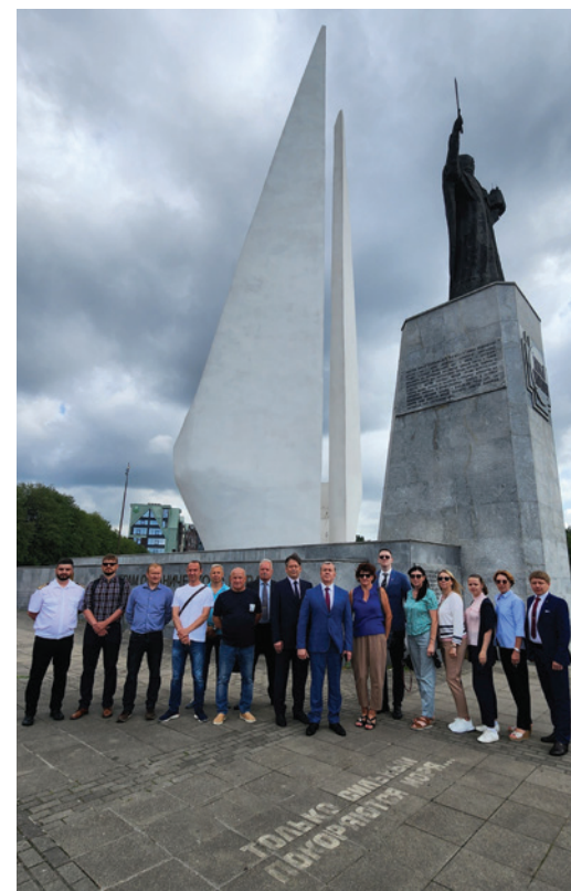
Работники Калининградского филиала ООО «Газпром флот»

Вот так необычно и насыщенно прошёл День работников морского и речного флота в нашей компании. Несмотря на расстояния и местонахождение, газпромфлотовцы чувствуют надёжное плечо товарища, ценят