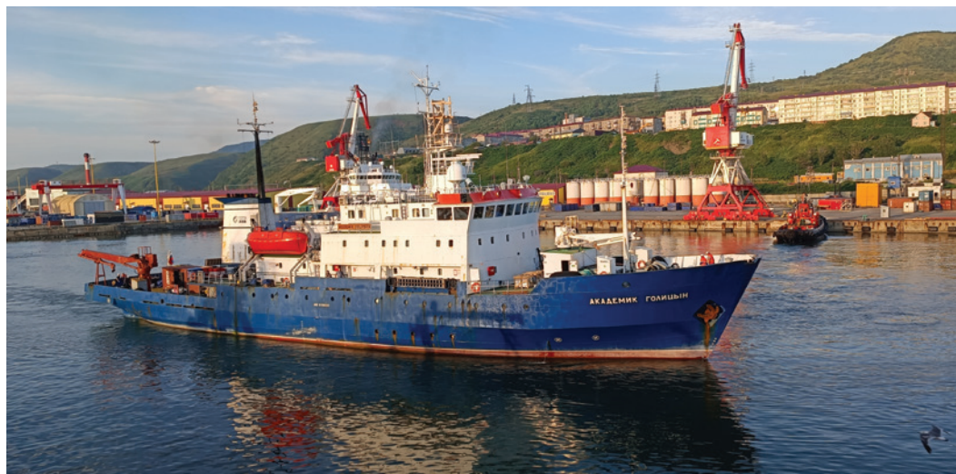
НИС «Академик Голицын» в порту Холмска

В этом году научно-исследовательское судно «Академик Голицын» преодолело свыше 24 000 км (13 143 морских миль), пройдя от самой западной точки России до её восточных окраин, миновав тайфуны и преодолев шторма, по водам двух океанов, восьми морей, семи проливов и одного канала.