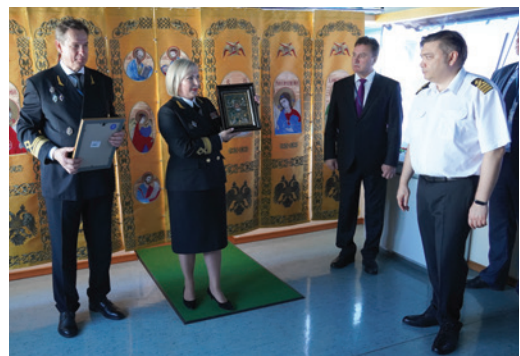
Передача экипажу иконы Николая Чудотворца

Первые упоминания о походных храмах на Руси появились в XVI веке, когда Иван Грозный отправился на Казань. В долгих кампаниях духовное окормление войск имело важное значение, помогало воинам обрести боевой настрой и удовлетворить их душевные нужды. При Петре Первом в штат каждого полка была введена должность военного священника, которая просуществовала вплоть до начала XX века. Кроме того, и на флоте Пётр I обязал содержать священников. При священнослужителе всегда имелся разборный шатёр с богослужебной литературой и образами святых. Спустя годы после Октябрьской революции 1917 года традиция передачи походных храмов возрождается не только в Вооружённых силах России, но и на флоте, в том числе гражданском.